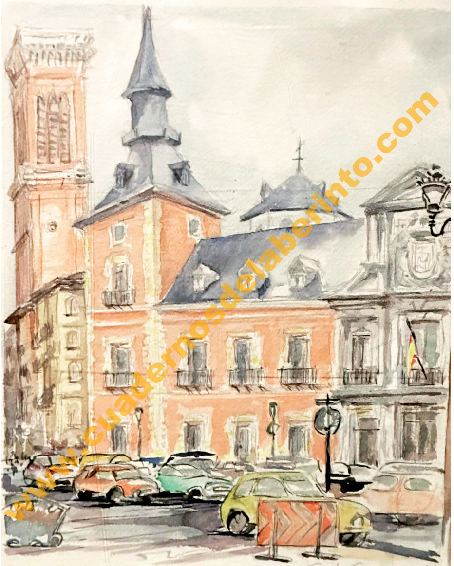
PALACIO DE SANTA CRUZ ACUARELA DEL EMBAJADOR ENRIQUE SUÁREZ DE PUGA VILLEGAS