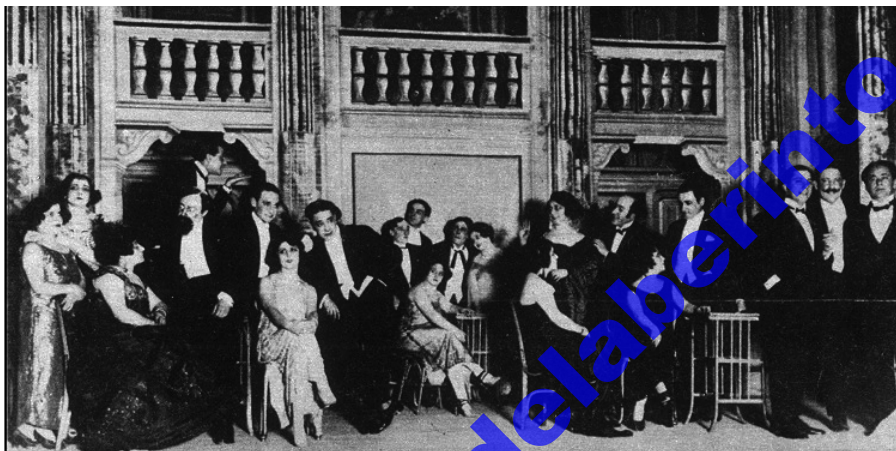
La Compañía Rivera-De Rosas en el Teatro Apolo de Madrid en enero de 1924. Gardel y Razzano aparecen en el extremo derecho de la fotografía.

se reencontraron con el ya Premio Nobel de Literatura Jacinto Benavente, al que habían conocido un año antes en Buenos Aires, y, como frecuentaban los cafés y la vida nocturna madrileña, saludaron al escritor Ramón del Valle-Inclán, al torero Ignacio Sánchez Mejías y a los actores María Guerrero y Fernando Díaz de Mendoza, entre otros 9 .