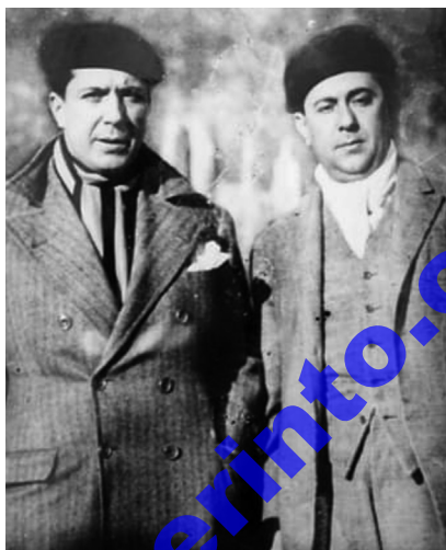
Gardel y Razzano en Vigo. 1923.

En Madrid no faltaron quienes quisieron aprovecharse de la ingenuidad de Gardel y de Razzano, como un mozo que anteriormente trabajaba en el cabaret Armenonville de Buenos Aires, donde fueron contratados por primera vez como dúo; este hombre les rogó que les diera dinero para un hijo suyo que se estaba muriendo y que resultó que no existía. También les sucedió el caso de un argentino que pidió dinero a